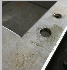
Vergusstaschen mit Vergussmörtel bis 1cm unter Oberkante füllen