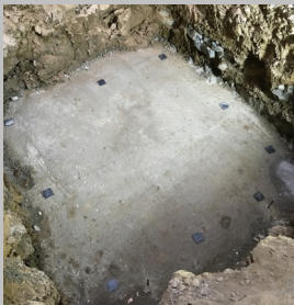
Untergrund waagrecht herstellen und auf Höhe bringen. (Ausgleichsblättchen)