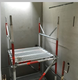
Geeignete Absturzsicherung oder Gerüst an- bzw. einbauen