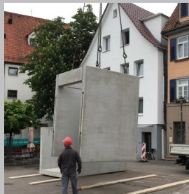
Schacht mit Ausgleichshänge ausrichten