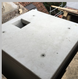
Gewindestangen in Deckelunterseite eindrehen und versetzen.