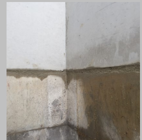
Oberfläche für weitere Schächte reinigen bzw. Mörtel aufbringen