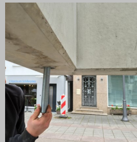
Gewindestangen an Unterseite eindrehen